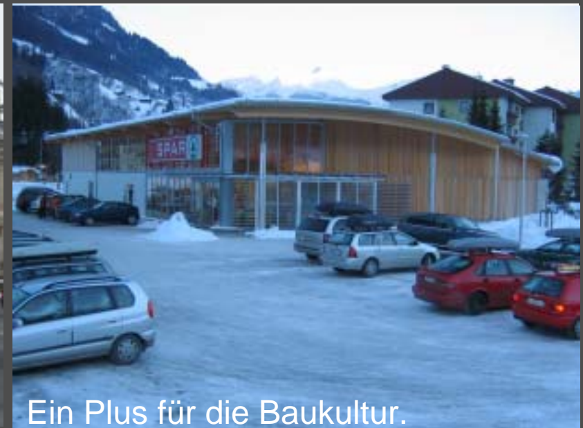
Ein Plus für die Baukultur.