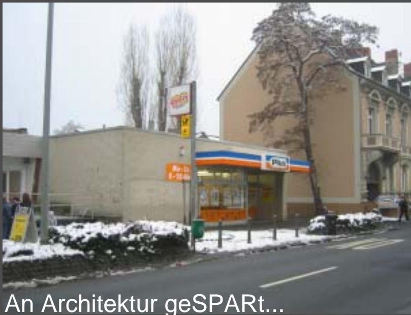
An Architektur geSPARt...

Neue Siedlungsflächen zeichnen sich im Hinblick auf Architektur und Städtebau durch besondere Beschränktheit aus.