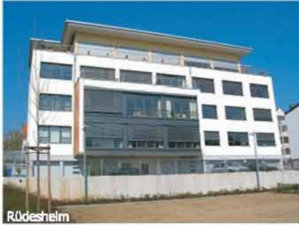
Wohltuend gegliederte moderne Fassade: die Anordnung der Fensterflächen folgt einem strengen Ordnungsprinzip