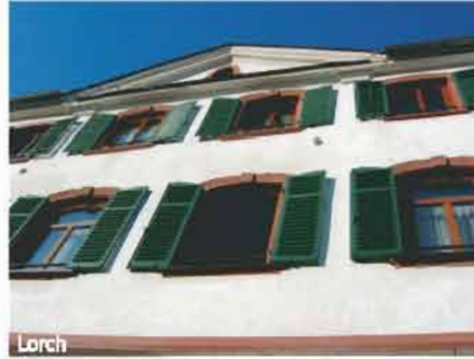
Gliederung und Rhythmisierung durch achsiale Fensteranordnung, Klapppläden und in Farbe und Material abgesetzte Gewände